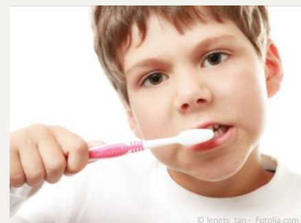
Bei der Prophylaxe lernen Ihre Kinder die richtige Zahnpflege.

Es gibt also keinen Grund, warum Sie auf Prophylaxe für Ihre Kinder verzichten sollten.