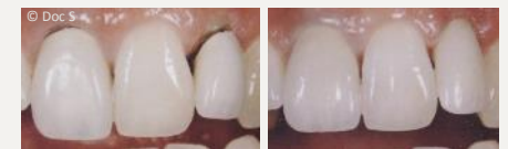
Metallkeramik-Kronen mit dunklen Rändern (links) und ästhetische Kronen aus reiner Keramik (rechts).

Wenn Sie wirklich schöne Zähne wollen, sollten Sie sich für Kronen und Brücken aus reiner Keramik entscheiden.