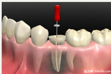
Wurzelbehandlung eines zerstörten Zahnes

Wurzelbehandlungen werden generell mit Betäubung durchgeführt. Deshalb sind sie in aller Regel nicht schmerzhaft . In seltenen Fällen (wenn ein Zahnerv sehr stark entzündet ist), können trotz Betäubung während der Behandlung vorübergehend Schmerzen auftreten.