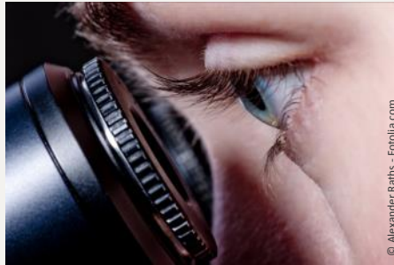
Wurzelbehandlung mit Hilfe des Mikroskops: Bis zu 25-fache Vergrößerung ermöglicht exakteres Arbeiten und bessere Ergebnisse.

Wurzelkanäle sind nur wenige Zehntelmillimeter dünn. Sie können Verästelungen, Krümmungen oder Stufen haben. Mit bloßem Auge sind solche Feinheiten nicht erkennbar. Deshalb werden sie leider oft übersehen.