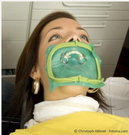
Kofferdam (Spanngummi) zum Schutz vor Bakterien

Die Keimfreiheit bei der Wurzelbehandlung ist eine der wichtigsten Voraussetzungen für den langfristigen Erfolg.